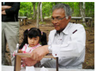
小田島棟梁ととんとんとん♪

6月7日(土) 毎年恒例、区界ハイキングが行われました。始めは雲行きが怪しかったですが、登山開始とともに晴れ、皆さんハイキングや山菜取りを楽しまれたと思います。2,3日前にはクマ目撃情報があるとのことで、炊事班はドキドキしながら、また登山組の無事を祈りながら、焼き肉、カレー、豚汁の準備をしました。自然の中で、体を動かしたりご飯を食べたりするのは格別に気持ちが良いですね。食後のお子様たちは工作でプラントアを作りました。この工作の時間を楽しみにしている方も多く、弊社で用意していたお花を植え、完成したプラントアを手にお花のお子様を見ると、親御さんも私たちも自然と笑顔になります。また来年も実施の際はお知らせしますので、是非ご参加ください。