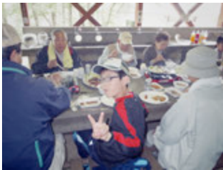
ハイキング後のご飯おいしい～