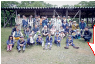
みんなで記念写真☆ いい思い出になりました